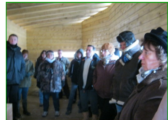
Echange entre intervenants depuis l'observatoire situé le long de l'étang Vaillant.

Point fort : L'aménagement du sentier d'interprétation pour les personnes à mobilité réduite. Un atout de plus pour le site !