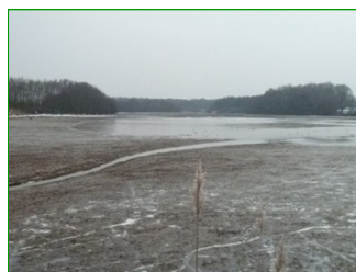
Étang Vaillant mis en assec après la pêche

“ L’avenir de ces milieux dépend des actions de chacun. Protéger leur biodiversité est un devoir citoyen. ”