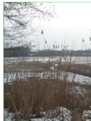
Alimentation d’un étang à l’autre

Compte-rendu de la visite du site des étangs Vaillant, du Crêt et du Fort