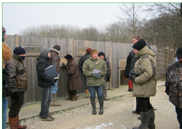
Découverte du sentier d’interprétation (observation depuis les palissades, aussi accessible aux personnes à mobilité réduite)

Le site des étangs Vaillant, du Crêt et du Fort a été choisi pour célébrer cette Journée Mondiale des Zones Humides en raison de sa valeur patrimoniale et de sa qualité touristique.